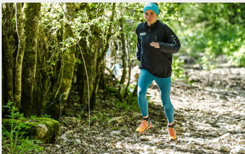
traileur- forêt (A. DESMIERS)