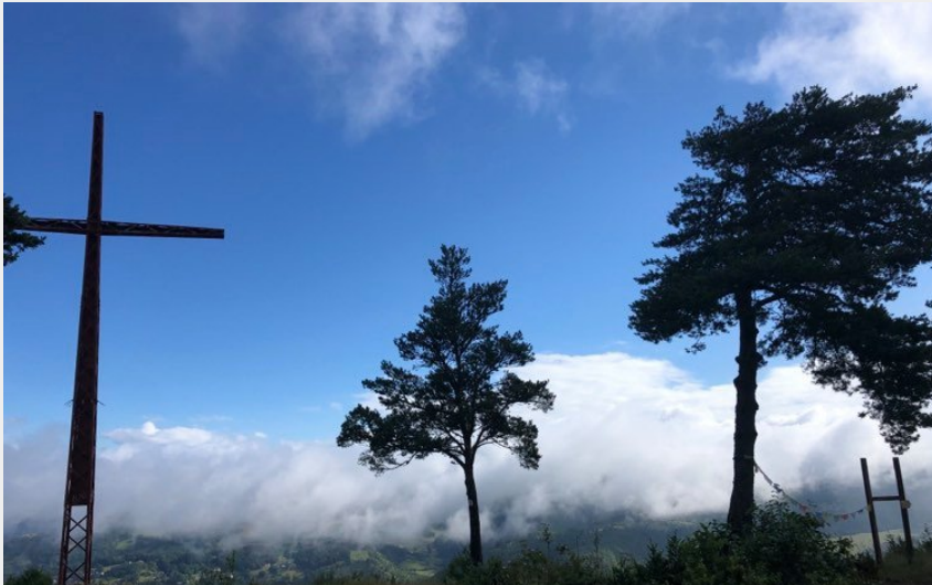
la croix de Roqueprins (Mathilde Sagnes)