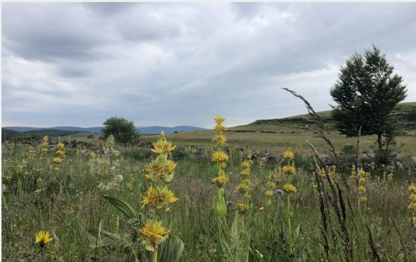
fleur (Mathilde SAGNES CD48)