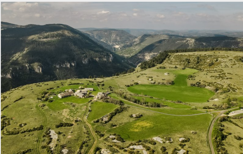
Causses et Gorges du Tarn- vu du ciel (DESMIERS)