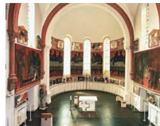
Musée Arcabas en Chartreuse

ou sur la carte de la Route des Savoir-Faire et des Sites Culturels (disponible gratuitement dans les offices de tourisme du massif).