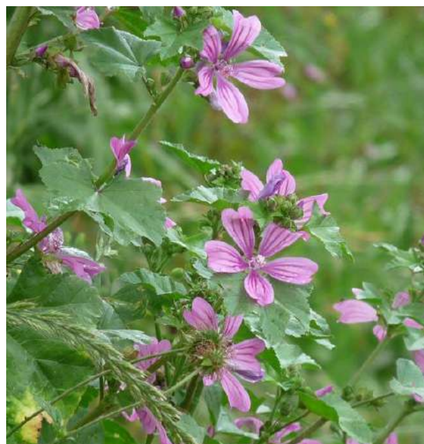
Mauves sur les bords du chemin.

gauche. Passer la ferme Mirassou et juste devant prendre à gauche un chemin dans les fougères. Passer la ferme Brouca et continuer chemin Lannezeque qui descend puis remonte. À droite, suivre le Chemin de Larret. Continuer sur la petite route jusqu'au village de Buzy. Prendre à droite puis tout de suite à gauche en traversant la D920 pour rejoindre le parking.