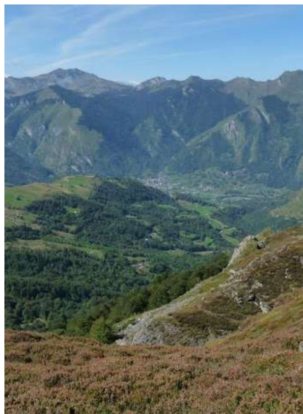
En arrière-plan, le village de Laruns.

2h30 5 716539 E - 4762675 N À droite, prendre un chemin qui traverse puis descend sur le Col d'Aubisque.