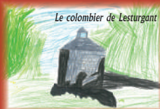
Le colombier de Lesturgant

1 - Le bois du Sence est un espace boisé pour la protection du captage d'eau. Malguénac est le point de séparation des cours d'eau dont les uns se jettent dans le Blavet et les autres dans la Sarre. Le ruisseau de Stival qui se jette dans le Blavet, prend sa source en amont de l'étang de Lesurgant, dans les fonds du village du Foz. Quelques autres ruisseaux grossissent quant à eux la Sarre, plus à l'Ouest.