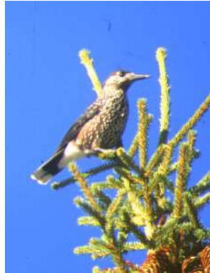
Le casse noix moucheté