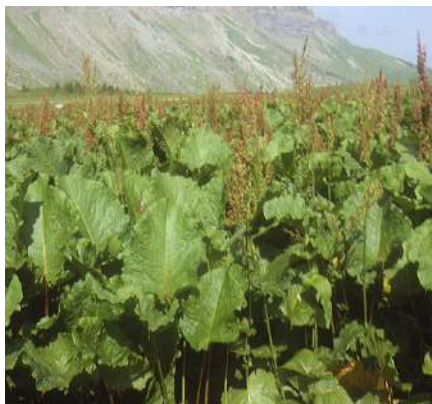
Une plante nitrophile : le rumex

Ces plantes trahissent l'ancienne présence d'un élevage bovin ou caprin. En effet, le stationnement des troupeaux lors des deux traites quotidiennes entraîne une accumulation des nitrates. A l'inverse, l'élevage des moutons laissés libres de leur va et vient ne produit pas une forte concentration en nitrates.