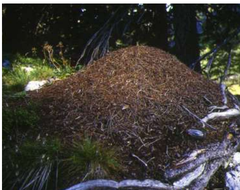
Le dôme caractéristique de la fourmière

Cette ouvrière des sous-bois qui mesure 5 à 7 mm et pèse jusqu'à 8 mg est indispensable à la bonne santé de la forêt. Elle aère le sol, le nettoie, se nourrit d'insectes et de larves parasites des arbres. Elle contribue ainsi au maintien du domaine forestier : un bien grand rôle pour une si petite espèce !