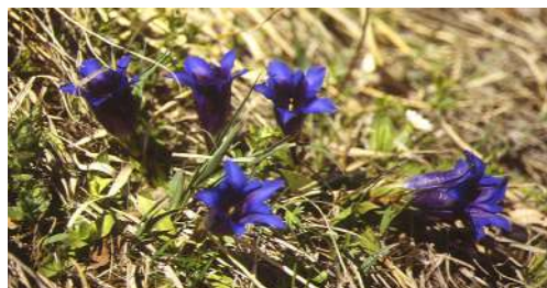
La gentiane acaule