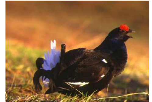
Le tétras: une espèce fragile

Après s'être nourri, le discret tétras passe sa journée tapi dans un fourré. Il est très sensible au bruit, il faudra donc être silencieux pour l'apercevoir. Des traces que vous pourrez déceler indiqueront sa présence : crottes en forme de bâtonnets, plumes, empreintes.