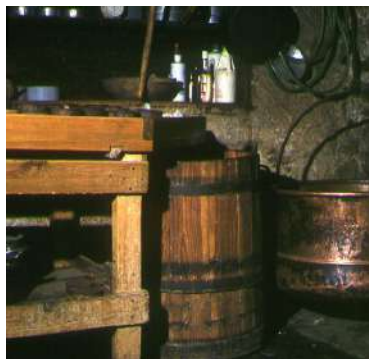
Des outils traditionnels

L'alpage d'Aujon perpétue encore un certain savoir faire : l'alpage est consacré aux vaches laitières et la transformation du lait se fait sur place, malgré l'évolution des techniques agricoles.