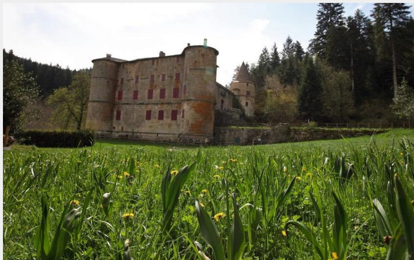
chateau de Roquedols