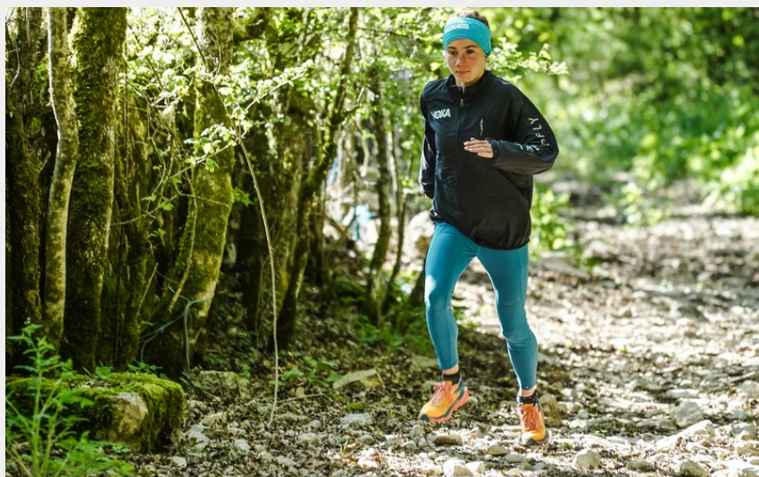
Traileur en forêt