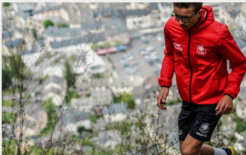
Traileur au dessus de Mende