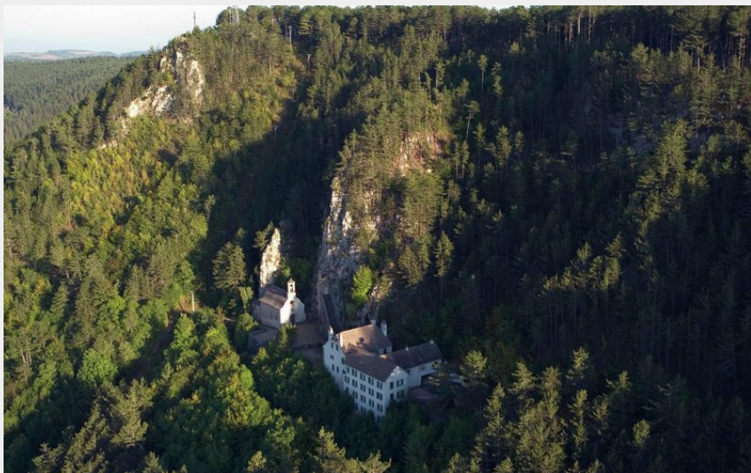
Hermitage Saint Privat