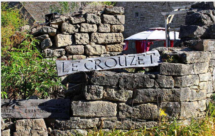
village du Crouzet