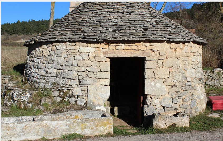
Puit dans le village du Falisson