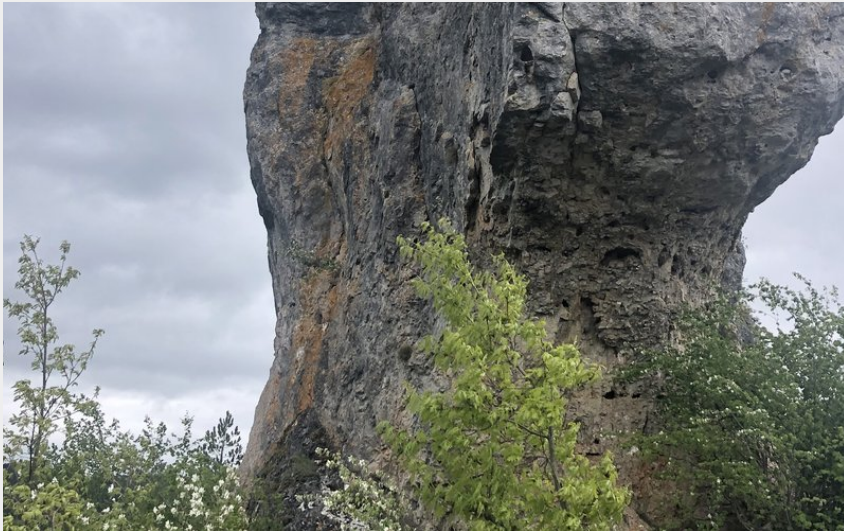
Lion de Balsièges