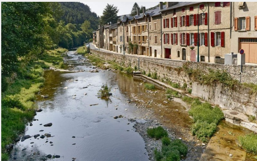
La Jonte à Meyrueis