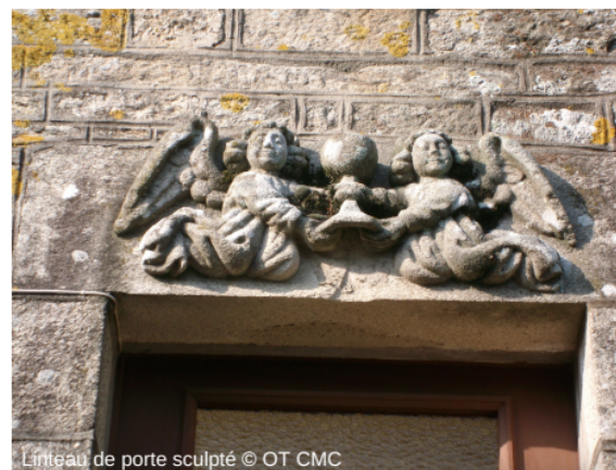
Linteau de porte sculpté