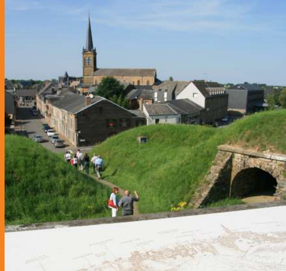
La cité en toile