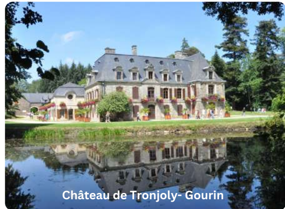
Château de Tronjoly- Gourin