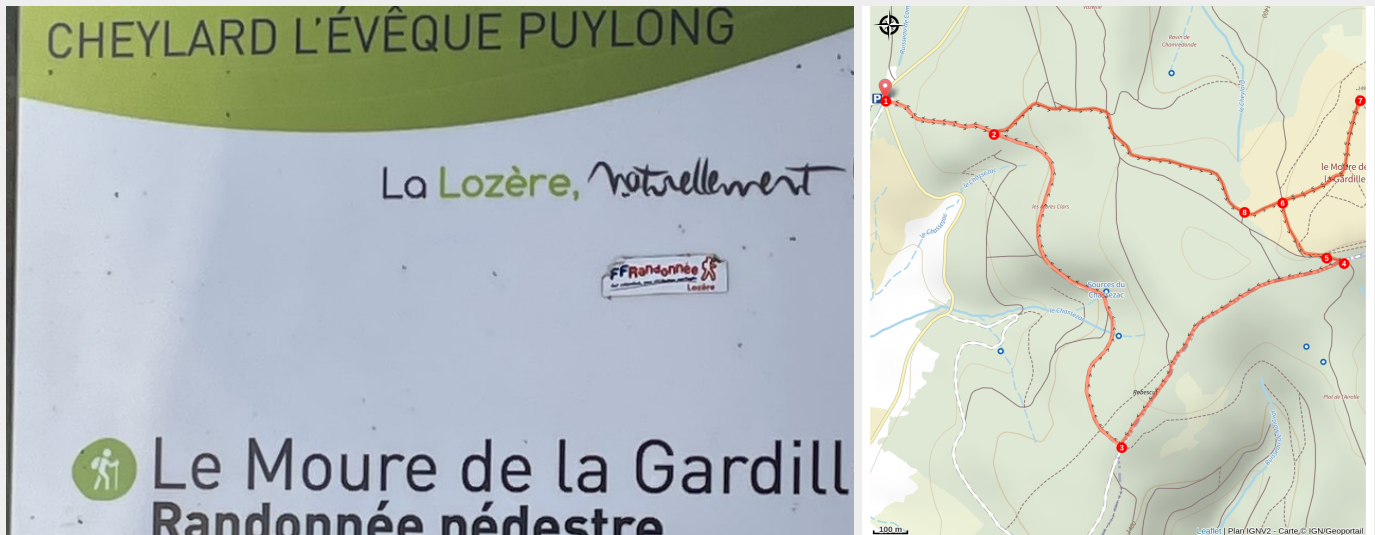
Panneau de départ de la randonnée