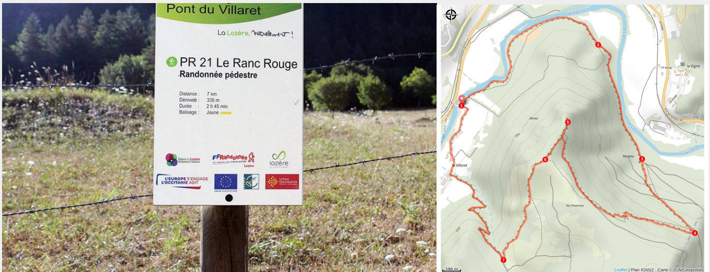
Panneau départ du sentier Ranc Rouge

Ce circuit, au départ du pont du Villaret, vous fera remonter le long du Lot sur sa rive gauche avant de grimper sur un éperon du Causse de Sauveterre dominé par le "Ranc rouge". Cette déformation du mot occitan "ronc" signifie "rocher" : ici, le calcaire est teinté de rougeâtre par des oxydes de fer. De ce point haut, la vue embrasse la vallée du Lot et la Margeride. En chemin, la fontaine de Saint-Véran évoque le premier emplacement du village de Barjac.