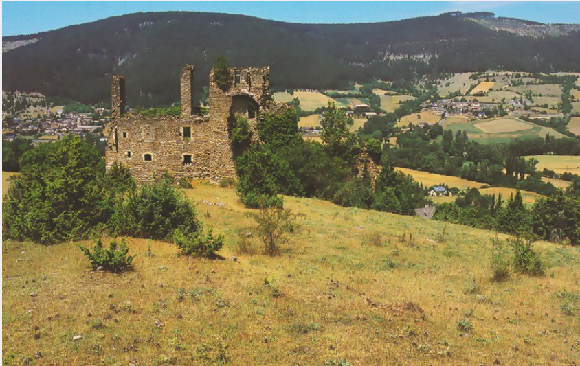
Ruines du château de Montialoux