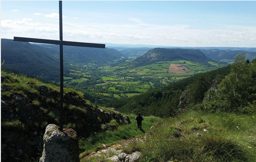
Truc de Balduc