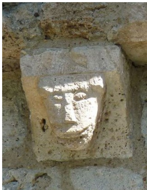
Détail de l'église d'Assouste du XII e siècle.

1h45 5 710794 E - 4762818 N Au niveau d'une grosse maison à galerie, prendre à gauche un sentier entre des murets qui descend à travers champs. Jolie vue sur Béost. Au bout de 100m, suivre à droite un chemin plus large qui rejoint le centre de Béost.