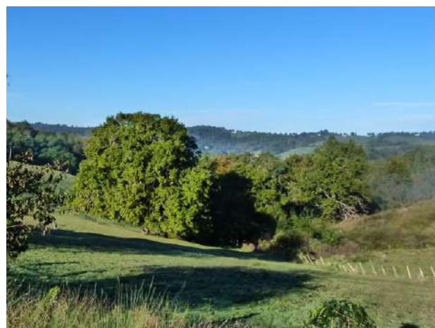
Vue sur le circuit depuis le chemin Sansans.

4 711656E - 4782225N Tout en bas, après la ferme, s'engager à gauche sur la route de Bosdarros en direction du point de départ. Elle longe agréablement la rive droite du Nééz.