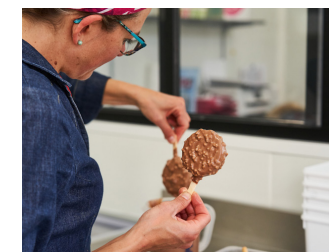
Eclat des Cimes