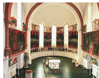
Musée Arcabas en Chartreuse

ou sur la carte de la Route des Savoir-Faire et des Sites Culturels (disponible gratuitement dans les offices de tourisme du massif).